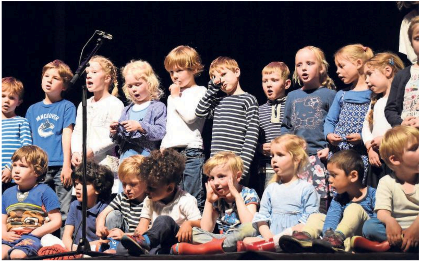
In een bijna anderhalf uur durende show zingen leerlingen vrije school Mareland liedjes van Annie MG Schmidt.