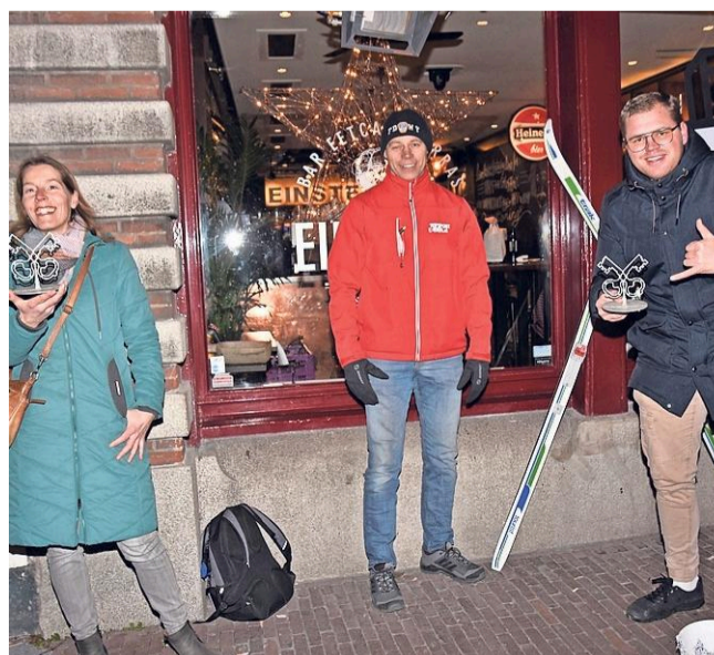
De prijsuitreiking van de Sleutellantaarn.