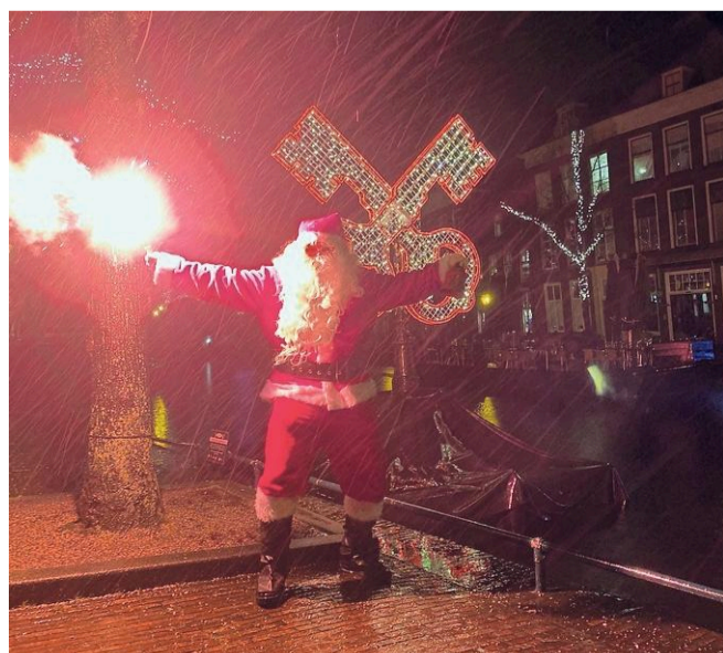
De winnende foto van Sam Boezaard.